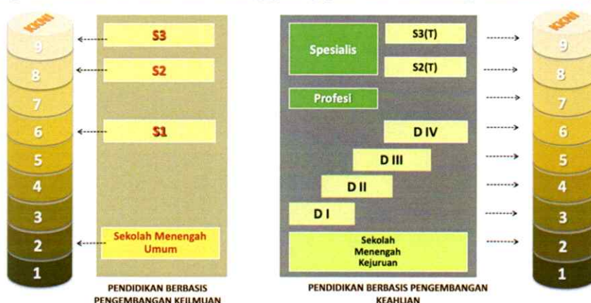
Gambar 1. Level Jenjang dalam KKN